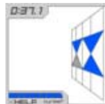
NURiPA PLUS 記憶力ゲーム