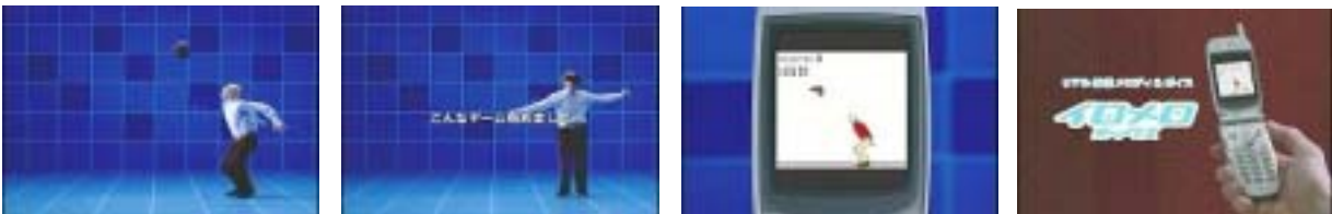
画像の無断転用禁止

スキンヘッドの男性が宙を見ながら何かに飛びかかろうとタイミングを計っている。その目線の先にやってきたのは、くるくると回転しながら宙を舞う黒い円盤のようなもの。狙いを定めて飛び上がった男性が、なんとその頭で円盤をナイスキャッチ！実は黒い円盤の正体はカツラだったのだ。成功の喜びを体いっぱいに表現する男性。