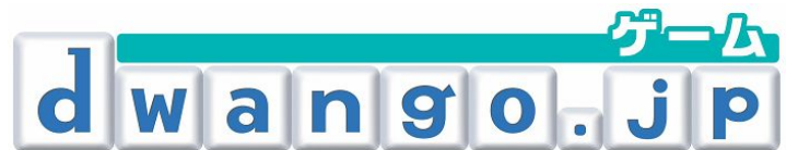
dwango.jp(ゲーム)ロゴ ※掲載画像の無断転用禁止