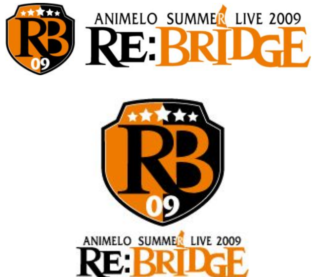
「Animelo Summer Live 2009 -RE:BRIDGE-」イメージロゴ ※画像の無断転用を禁止します。

「Animelo Summer Live（通称：アニサマ）」は第一回として2005年7月10日（日）「Animelo Summer Live 2005 -THE BRIDGE-」（国立代々木競技場第一体育館）を開催し、2006年7月8日（土）に「Animelo Summer Live 2006 -OUTRIDE-」（日本武道館）、2007年7月7日（土）「Animelo Summer Live 2007 Generation-A」（日本武道館）、そして昨年2日間の開催となった、2008年8月30日（土）、8月31日（日）「Animelo Summer Live 2008 -Challenge-」（さいたまスーパーアリーナ）と過去4回の開催を行ってきました。多くのアニメソングアーティストたちがレーベルの垣根を越えて集結し、ファンとアーティストを結ぶ架け橋としてイベント開催してきた「アニサマ」が、5年目を迎えた今年も開催が決定。さいたまスーパーアリーナを舞台に、昨年の動員を越える一日あたり約2万5000人収容のステージで、2009年8月22日（土）、8月23日（日）二日間に渡るアニメソング・スーパーライブを行います。本年のタイトルは、「Animelo Summer Live 2009 -RE:BRIDGE-」（アニメロサマーライブにせんきゅう リ・ブリッジ）。過去の熱気を上回る2009年のアニサマ開催にご期待ください。